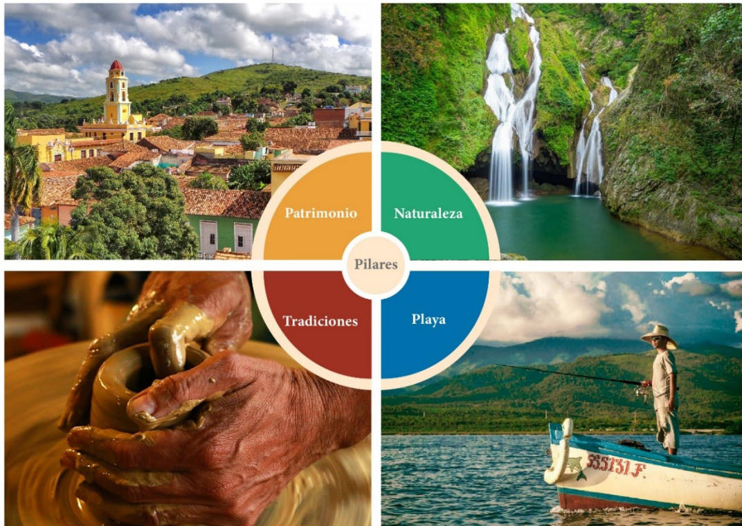
Figura 3. Relação entre os setores da marca e as cores

O universo criativo foi concebido em torno de um padrão de linhas descontínuas, de modo a assegurar a aplicabilidade da marca em diversos contextos, particularmente em situações onde o isológotipo ou o logótipo possam não ser utilizados (Figura 4). Este padrão de linhas fluidas e entrelaçadas alude aos diversos percursos da história local, enquanto as suas interseções simbolizam encontros. Acima de tudo, presta homenagem às artes ancestrais do rendado e do trançado de fibras.