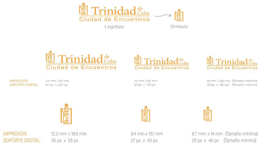
Figura 2. Apresenta o isologótipo da marca como resultado do processo participativo

no imaginário local como aquela que melhor representa a cidade e o seu património urbano. O texto do isologótipo incorpora o nome “Trinidad de Cuba”, numa tipografia com serifa, enquanto o slogan da marca, “cidade de encontros”, surge em tipografia sem serifa. Este contraste tipográfico realça o diálogo entre a dimensão histórica e patrimonial (com serifa) e a contemporânea (sem serifa).