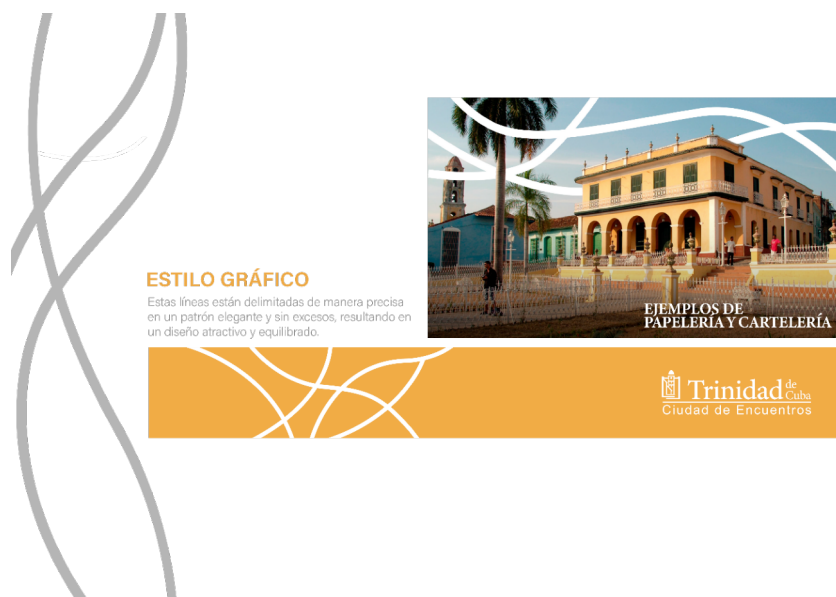
Figura 4. Aplicação do padrão da marca

O universo criativo foi concebido em torno de um padrão de linhas descontínuas, de modo a assegurar a aplicabilidade da marca em diversos contextos, particularmente em situações onde o isológotipo ou o logótipo possam não ser utilizados (Figura 4). Este padrão de linhas fluidas e entrelaçadas alude aos diversos percursos da história local, enquanto as suas interseções simbolizam encontros. Acima de tudo, presta homenagem às artes ancestrais do rendado e do trançado de fibras.