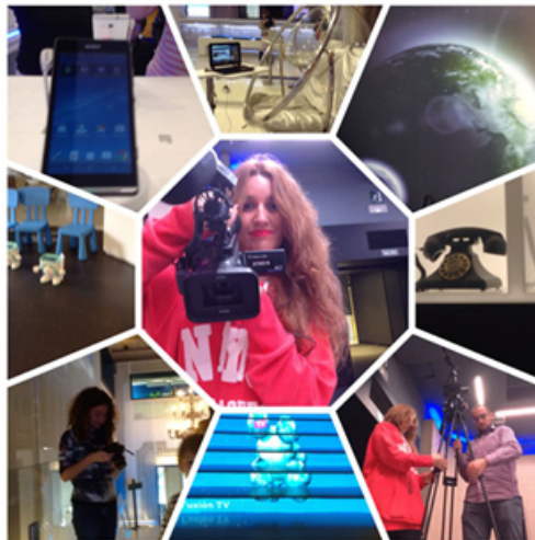
Figura 5: Colagem no iPad 13 (22/11/2014)

Seja uma selfie , um reflexo ou os pés, as representações que os participantes fazem de si próprios são um dos conteúdos mais difundidos, tanto dentro como fora do workshop; uma espécie de discurso mimético no qual os participantes nos falam do seu estado de espírito, experiências e localização no espaço. Quase sem perceberem, estão a construir uma história em que se tornam protagonistas. Um exemplo disso é a colagem que os participantes fizeram com as fotos que tiraram ao longo do workshop. Na Figura 5, vemos uma feita por uma menina de oito anos, resumindo assim a sua experiência, incluindo os objetos e as pessoas que nela participaram.