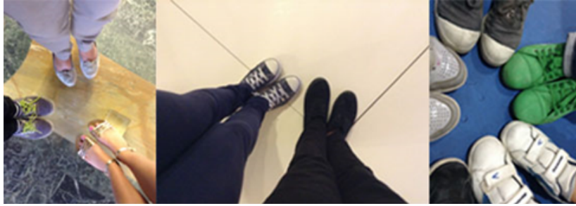
Figura 4: Pés e sapatos (vários iPads e sessões)

tendem a tirar fotos em frente a espelhos (Figura 3). Tendo em mente que o próprio iPad inclui uma câmara frontal que faz com que o ecrã funcione como um espelho, não faria sentido que este reflexo fosse retratado. Mesmo assim, as observações mostram que os participantes precisam de tirar fotos de tudo aquilo que os reflete, sejam espelhos, superfícies polidas ou até outros tablets. Outra representação constante nas fotos são os seus pés e os das pessoas à sua volta. Algumas das imagens podem ter sido tiradas por engano, mas este “tema” surge repetidamente, como podemos ver na Figura 4.