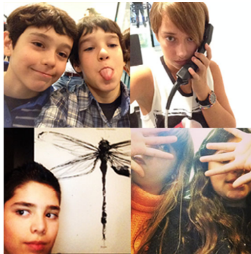
Figura 2: Selfies dos participantes (vários iPads e sessões)