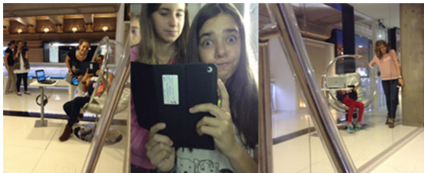
Figura 3: Imagens ao espelho (vários iPads e sessões)

Se há uma categoria que se destaca de tudo o resto no workshop, é a selfie . O motivo é que a primeira atividade proposta aos participantes é tirar uma selfie logo no início para ligar os seus rostos às fotografias que tiram ao longo do workshop. De qualquer forma, os participantes continuaram a usar este modelo ao longo do workshop com pequenas variações. Na Figura 2, podemos ver algumas dessas selfies : no lado superior esquerdo, encontramos a versão mais comum, a olhar diretamente para a câmara. No lado superior direito, fingem estar a realizar uma ação (neste caso, falar ao telefone). No lado inferior esquerdo, o participante aparece ao lado de outro objeto ao qual deseja associar a sua imagem. Finalmente, no lado inferior direito, há duas participantes a fazer uma espécie de pose. Em todos os casos, a representação do eu é o conteúdo fundamental da imagem, mas se levarmos em conta a “encenação”, a mensagem será mais ou menos complexa.