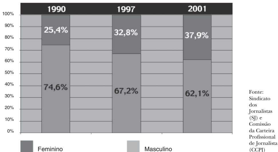
Gráfico 2 – Percentagem de jornalistas por género

Esta tendência é particularmente visível, como se imaginaria, nos escalões mais jovens da profissão. De entre os titulares de carteira profissional com menos de 30 anos, o número de mulheres é já mais elevado do que o de homens (798 contra 649); a mesma realidade se verifica nos detentores de título provisório de jornalista estagiário, onde existem 222 mulheres e 214 homens.